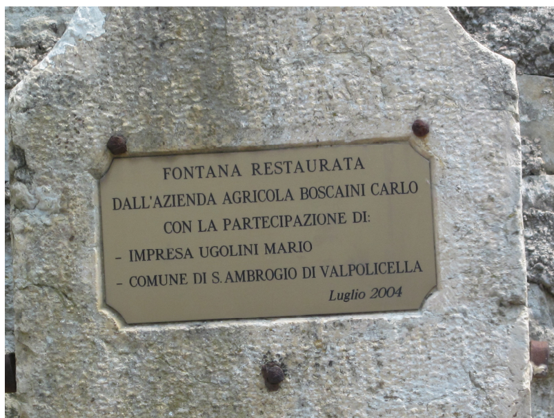
Fontana Sengia, Via Sengia