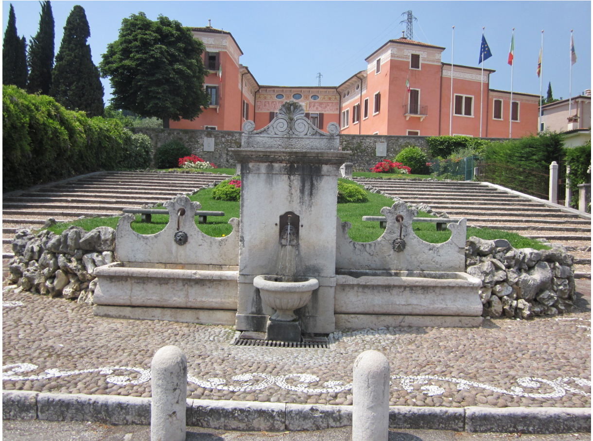
Fontana Municipale, Piazza Vittorio Emanuele, auf dem Parkplatz vor dem Rathaus